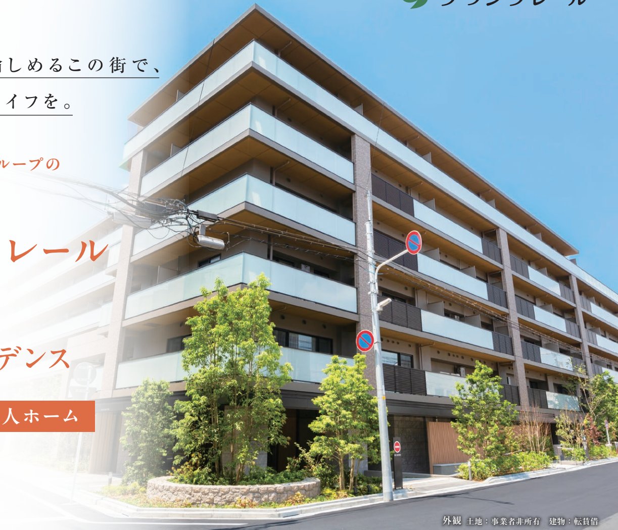
外観 土地：事業者非所有 建物：転賃借